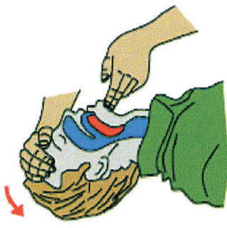
Uvolni dýchací cesty